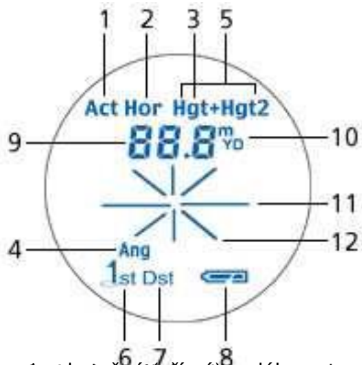
1. Dálkoměr s výškoměrem a vzdálenost